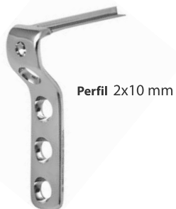
Perfil 2x10 mm