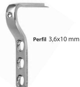
Perfil 3,6x10 mm