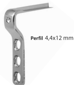
Perfil 4,4x12 mm