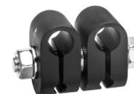
10 CONECTORES UNIVERSAL